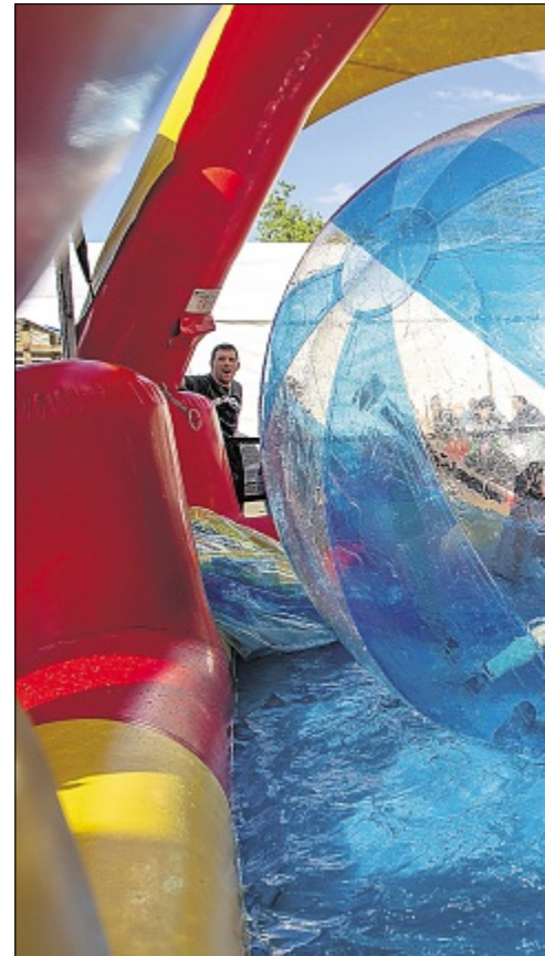
Planschen einmal anders: Die Kids flitzten trockenen F